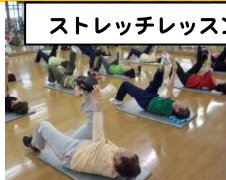
ストレッチレッスン