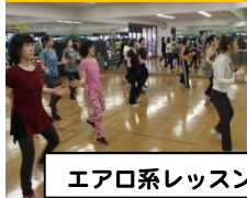
エアロ系レッスン